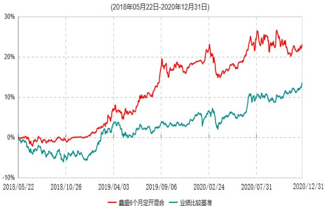
财通资管鑫盛6个月定期开放混合型证券投资基金累计净值增长率与业绩比较基准收益率历史走势对比图

注：自基金合同生效至报告期末，财通资管鑫盛6个月定期开放混合型证券投资基金份额净值增长率为23.28%，同期业绩比较基准收益率为13.71%。