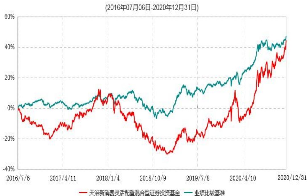
天治新消费灵活配置混合型证券投资基金累计净值增长率与业绩比较基准收益率历史走势对比图