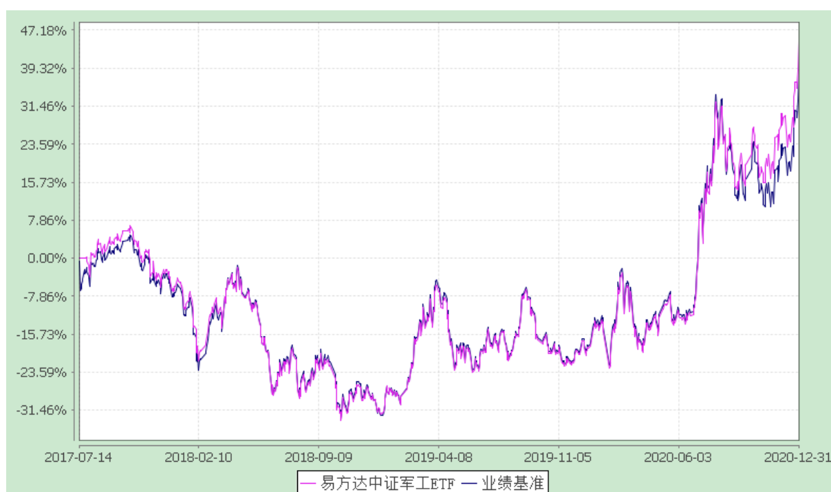
易方达中证军工交易型开放式指数证券投资基金 份额累计净值增长率与业绩比较基准收益率历史走势对比图 (2017年7月14日至2020年12月31日)

注：自基金合同生效至报告期末,基金份额净值增长率为 44.97%,同期业绩比较基准收益率为 38.49%。