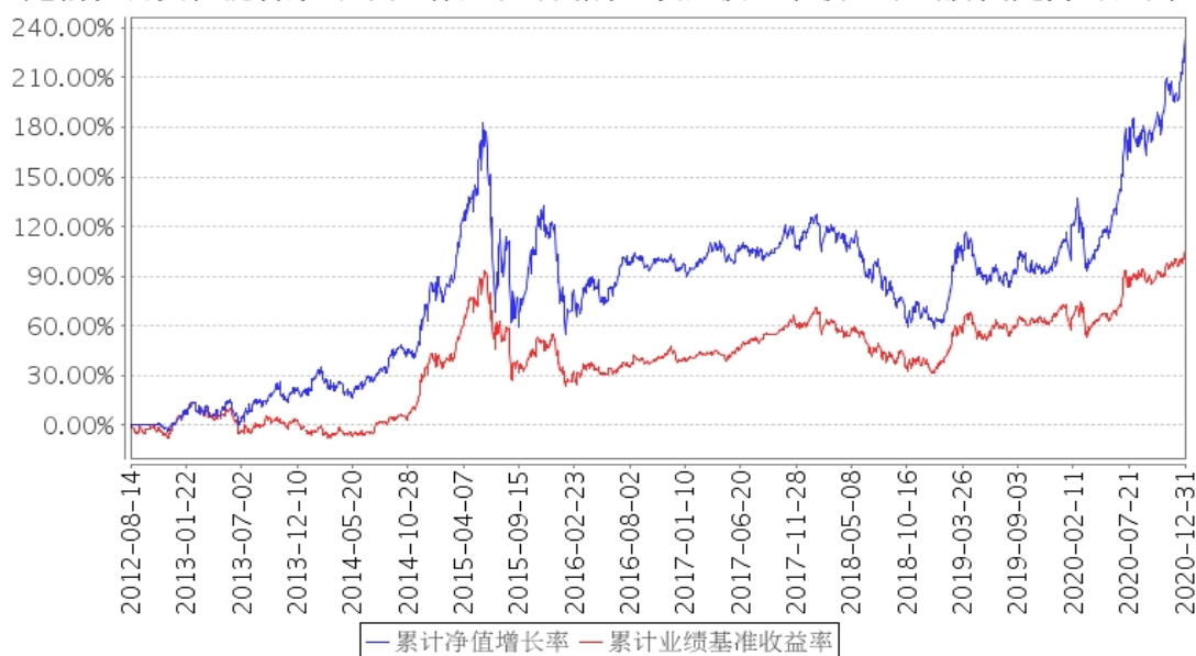
建信社会责任混合累计净值增长率与同期业绩比较基准收益率的历史走势对比图