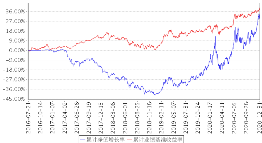
平安鼎泰混合累计净值增长率与同期业绩比较基准收益率的历史走势对比图