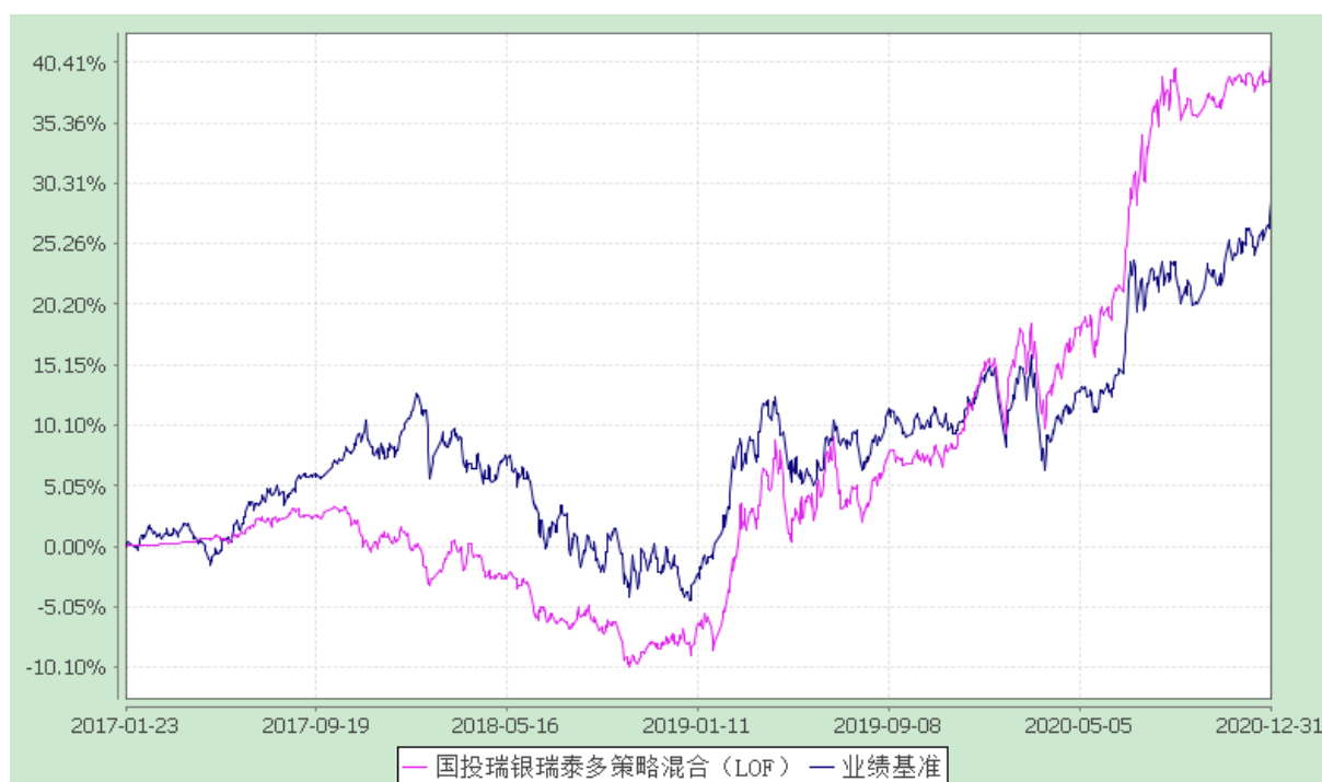
国投瑞银瑞泰多策略灵活配置混合型证券投资基金（LOF） 份额累计净值增长率与业绩比较基准收益率的历史走势对比图 (2017 年 1 月 23 日至 2020 年 12 月 31 日)

注：本基金建仓期为自基金合同生效日起的六个月。截至建仓期结束，本基金各项资产配置比例符合基金合同及招募说明书有关投资比例的约定。