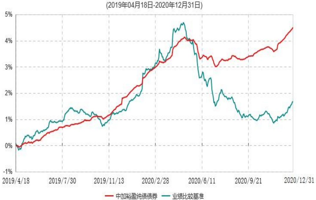
中加裕盈纯债债券型证券投资基金累计净值增长率与业绩比较基准收益率历史走势对比图

注：1.本基金的基金合同于2019年4月18日生效，截至本报告期末，本基金合同生效已满一年。