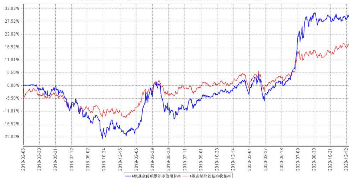
A级基金份额累计净值增长率与同期业绩比较基准收益率的历史走势对比图