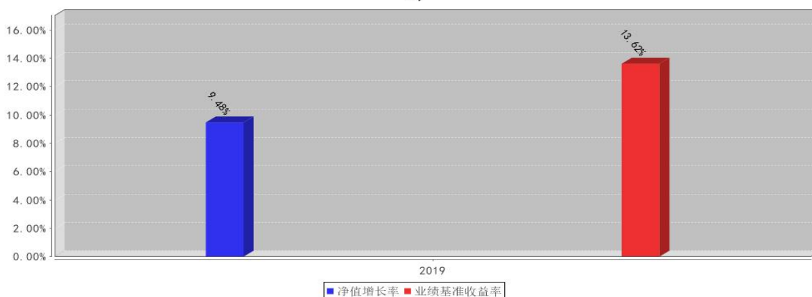
银华MSCI中国A股ETF发起式联接A基金每年净值增长率与同期业绩比较基准收益率的对比图 (2019年12月31日)