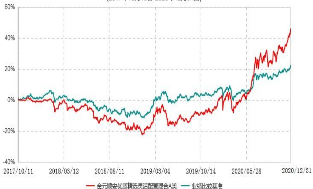
金元顺安优质精选灵活配置混合C类累计净值增长率与业绩比较基准收益率历史走势对比图