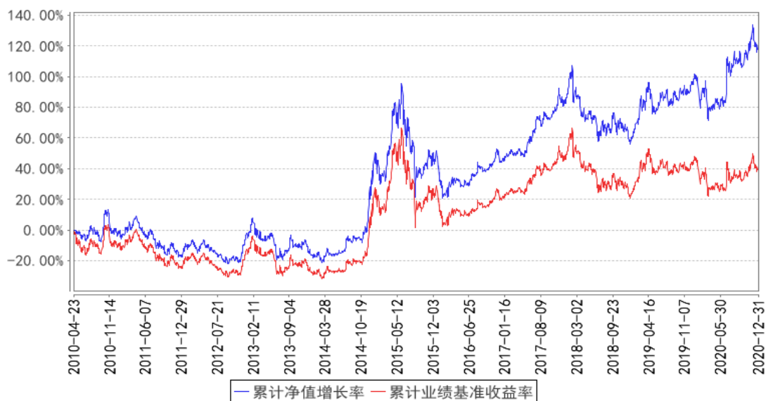
华宝上证180价值ETF联接累计净值增长率与同期业绩比较基准收益率的历史走势对比图

注：按照基金合同的约定，自基金成立日期的 3 个月内达到规定的资产组合，截至 2010 年 7 月底，本基金已达到合同规定的资产配置比例。