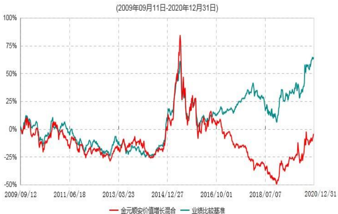
金元顺安价值增长混合型证券投资基金累计净值增长率与业绩比较基准收益率历史走势对比图