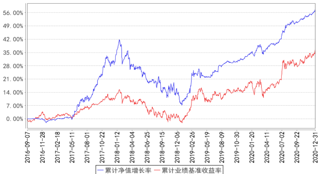
华宝新活力混合累计净值增长率与同期业绩比较基准收益率的历史走势对比图

注：按照基金合同的约定，基金管理人应当自基金合同生效之日起六个月内使基金的投资组合比例符合基金合同的有关约定，截至 2017 年 3 月 7 日，本基金已达到合同规定的资产配置比例。