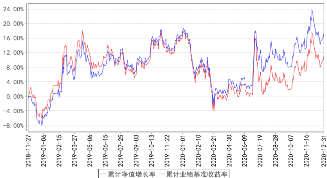
华宝银行ETF联接A累计净值增长率与同期业绩比较基准收益率的历史走势对比图