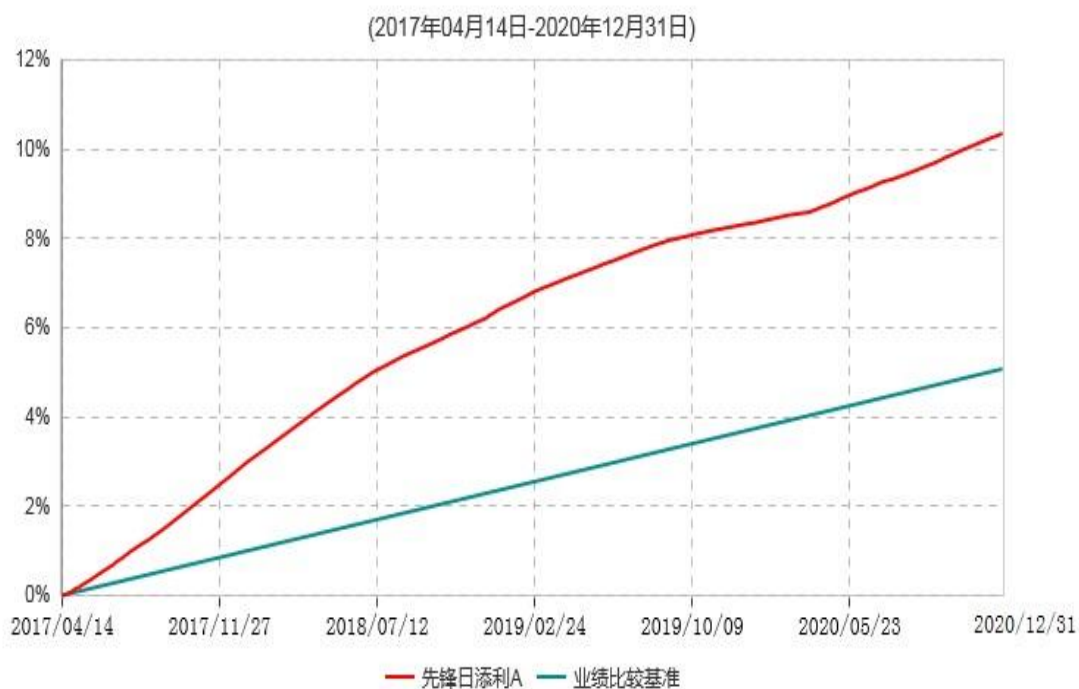
先锋日添利A累计净值收益率与业绩比较基准收益率历史走势对比图