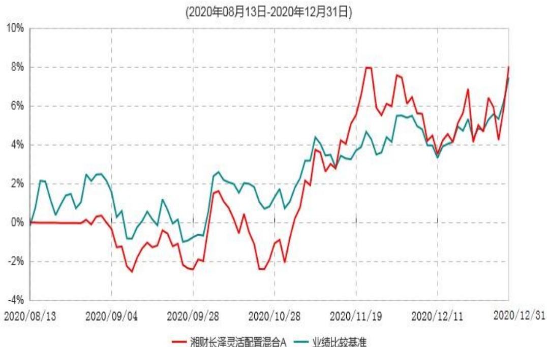
湘财长泽灵活配置混合A累计净值增长率与业绩比较基准收益率历史走势对比图