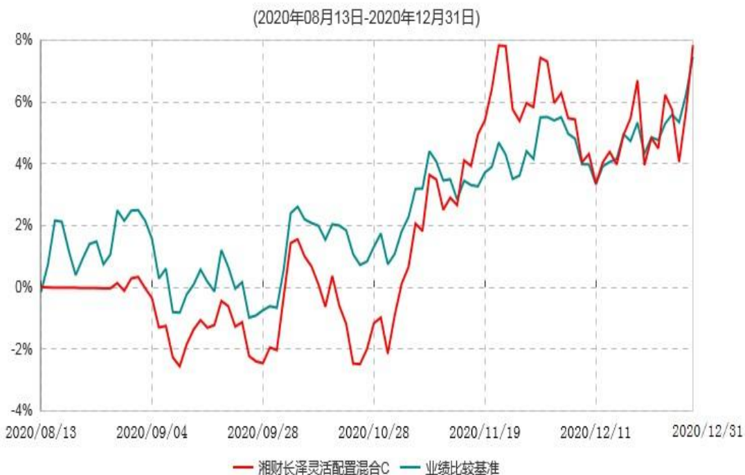
湘财长泽灵活配置混合C累计净值增长率与业绩比较基准收益率历史走势对比图