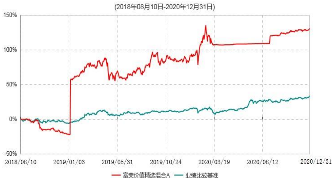
富荣价值精选混合A累计净值增长率与业绩比较基准收益率历史走势对比图