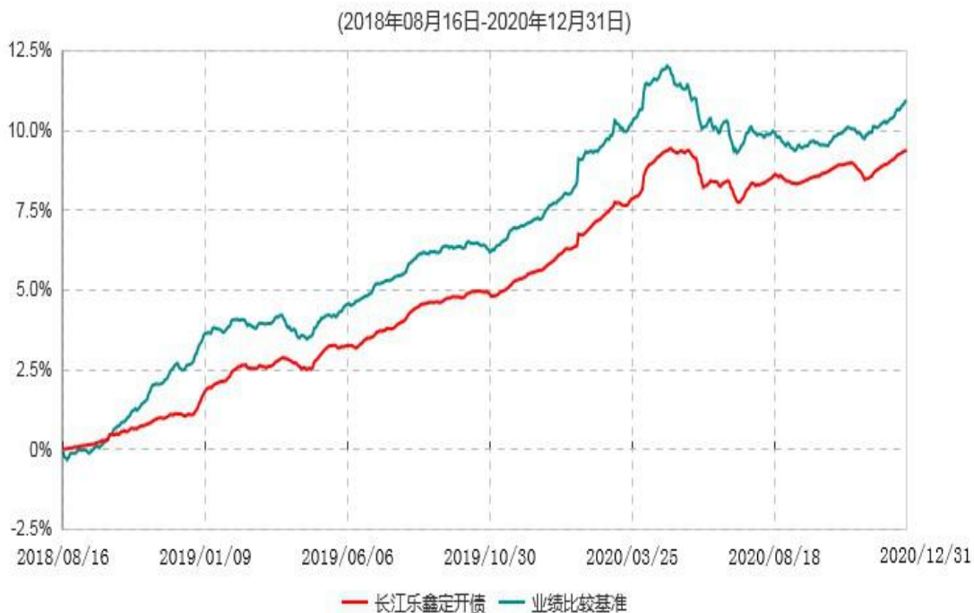
长江乐鑫纯债定期开放债券型发起式证券投资基金累计净值增长率与业绩比较基准收益率历史走势对比图