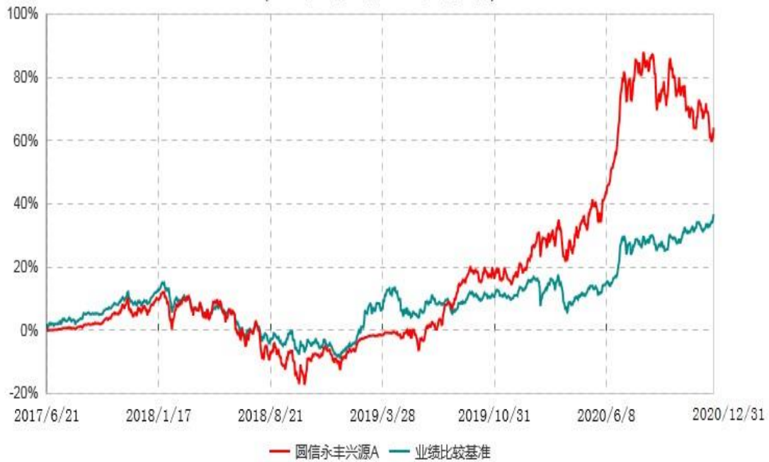
圆信永丰兴源C累计净值增长率与业绩比较基准收益率历史走势对比图