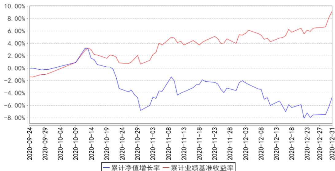
泰达宏利高研发创新6个月混合A累计净值增长率与同期业绩比较基准收益率的历史走势对比图