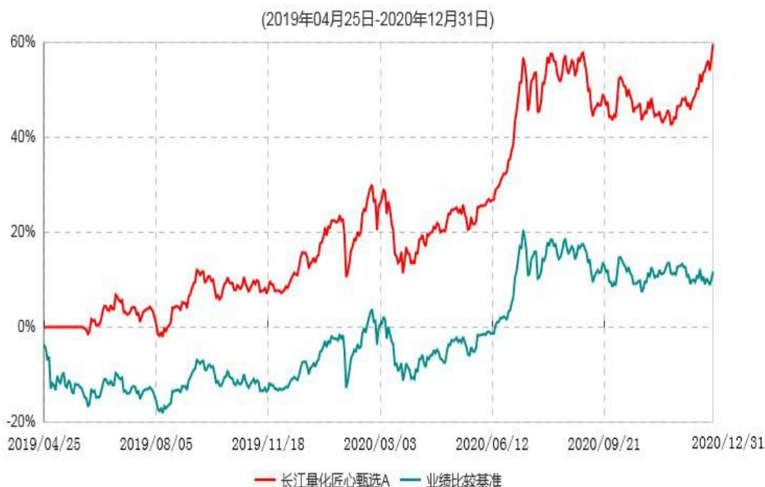
长江量化匠心甄选A累计净值增长率与业绩比较基准收益率历史走势对比图