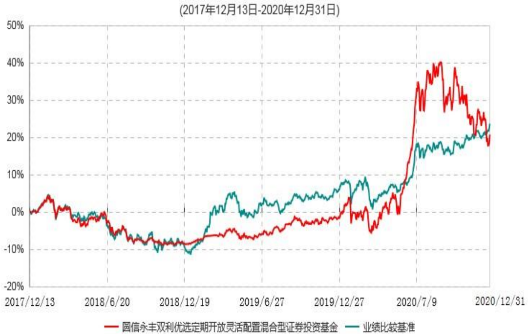
圆信永丰双利优选定期开放灵活配置混合型证券投资基金累计净值增长率与业绩比较基准收益率历史走势对比图