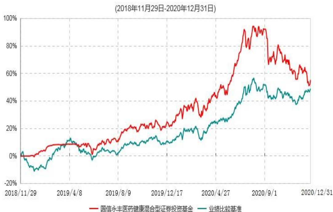
圆信永丰医药健康混合型证券投资基金累计净值增长率与业绩比较基准收益率历史走势对比图