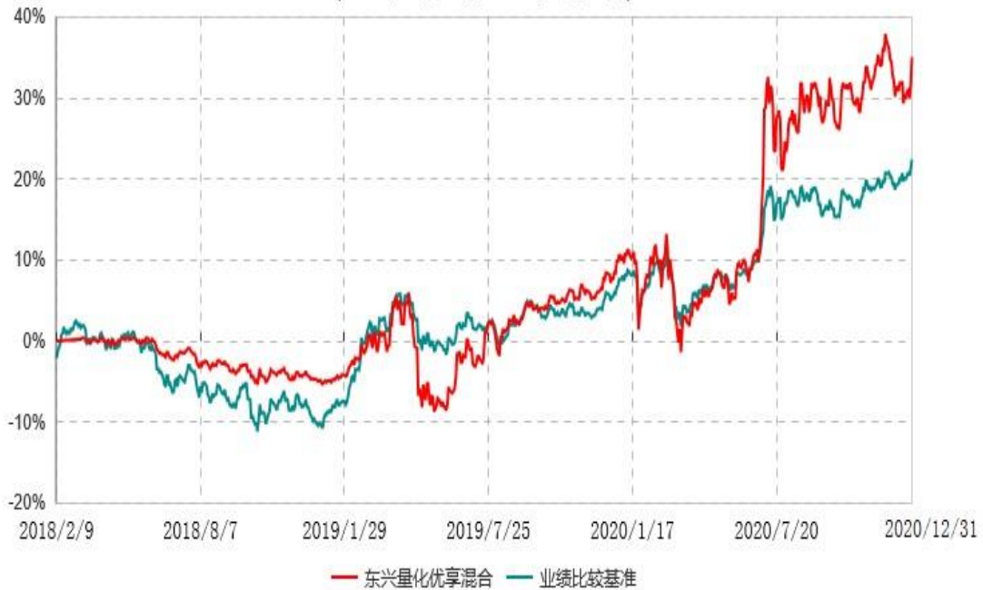
东兴量化优享灵活配置混合型证券投资基金累计净值增长率与业绩比较基准收益率历史走势对比图 (2018年02月09日-2020年12月31日)