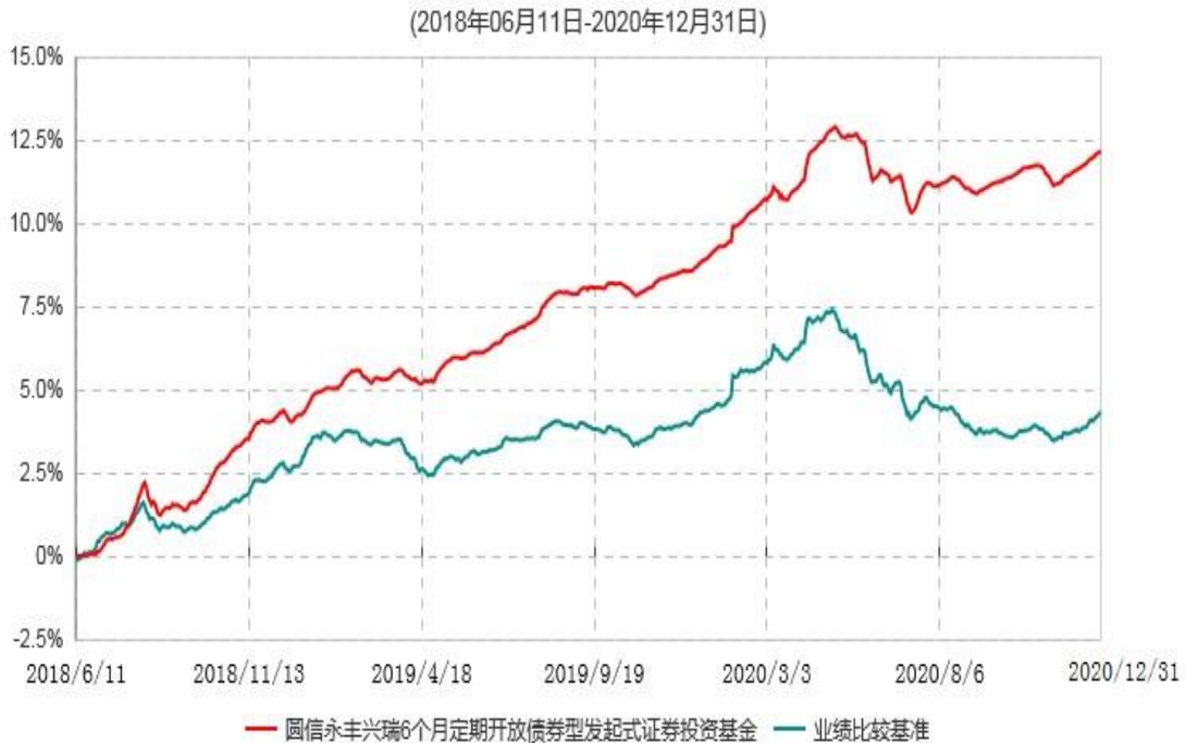
圆信永丰兴瑞6个月定期开放债券型发起式证券投资基金累计净值增长率与业绩比较基准收益率历史走势对比图