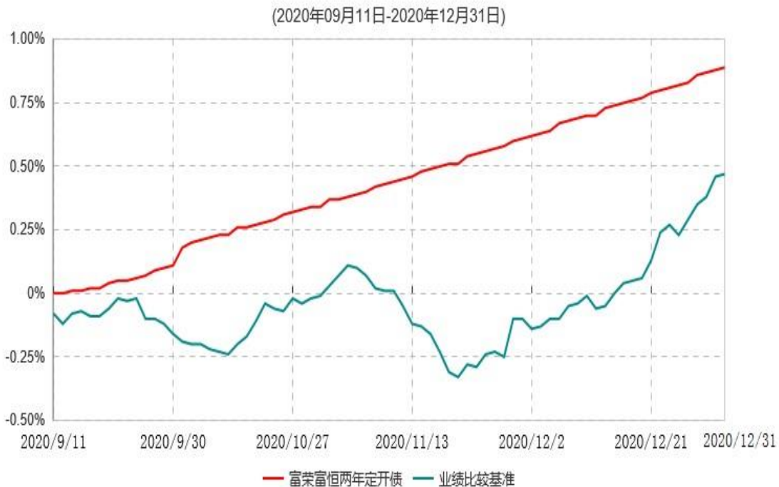
富荣富恒两年定期开放债券型证券投资基金累计净值增长率与业绩比较基准收益率历史走势对比图

注：①本基金的基金合同于2020年9月11日生效，截至2020年12月31日止，本基金成立未满1年。