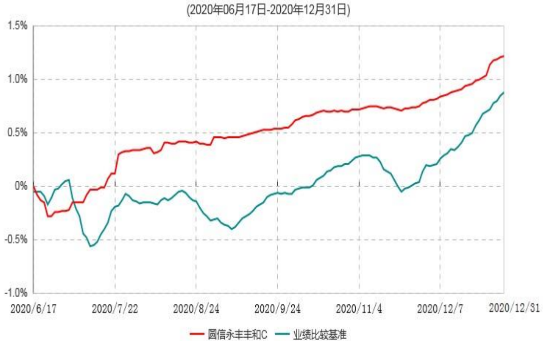
圆信永丰丰和C累计净值增长率与业绩比较基准收益率历史走势对比图

注：自基金合同生效后，截止报告期末，本基金成立不满一年；本基金已完成建仓但报告期末距建仓结束不满一年，建仓结束时各项资产配置比例符合合同约定。