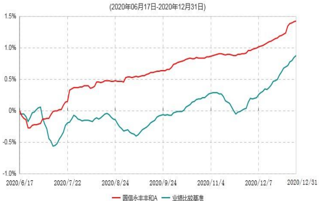
圆信永丰丰和A累计净值增长率与业绩比较基准收益率历史走势对比图