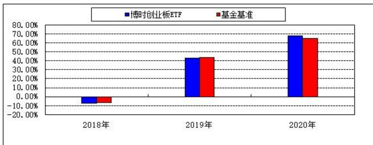
自基金转型以来基金净值增长率与业绩比较基准收益率的对比图

注：本基金合同于 2018 年 12 月 10 日生效，合同生效当年按实际存续期计算，不按整个自然年度进行折算。