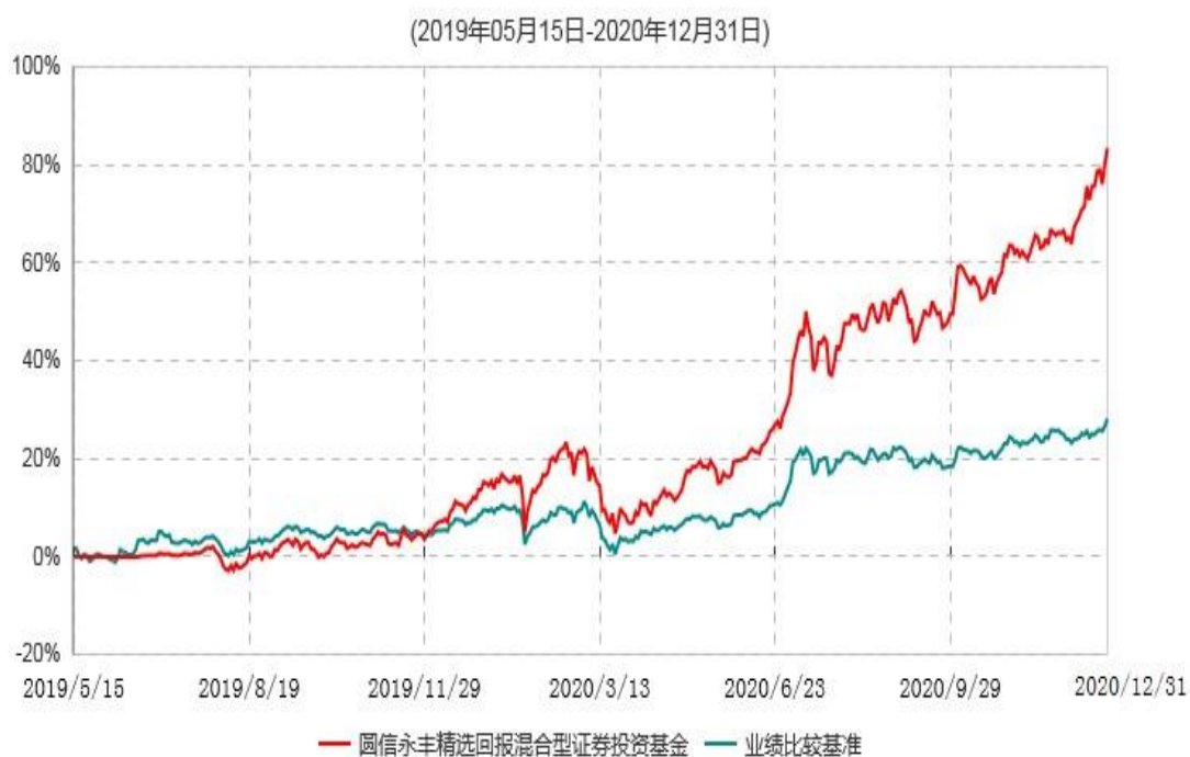
圆信永丰精选回报混合型证券投资基金累计净值增长率与业绩比较基准收益率历史走势对比图