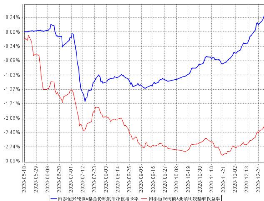
同泰恒兴纯债A基金份额累计净值增长率与同期业绩比较基准收益率的历史走势对比图