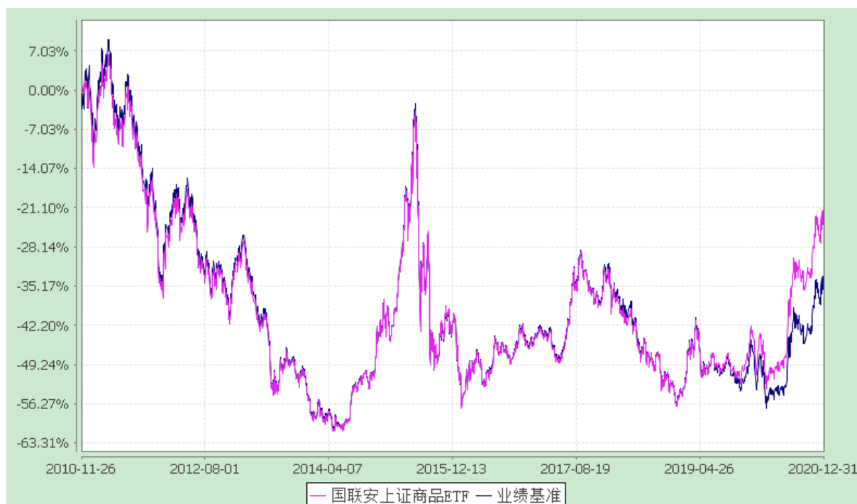
自基金合同生效以来份额累计净值增长率与业绩比较基准收益率的历史走势对比图 (2010 年 11 月 26 日至 2020 年 12 月 31 日)