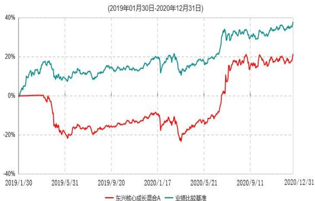
东兴核心成长混合A累计净值增长率与业绩比较基准收益率历史走势对比图