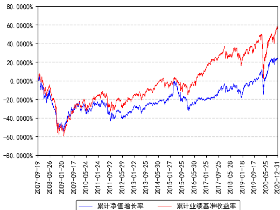
南方全球精选配置(QDII-FOF)累计净值增长率与同期业绩比较基准收益率的历史走势对比图