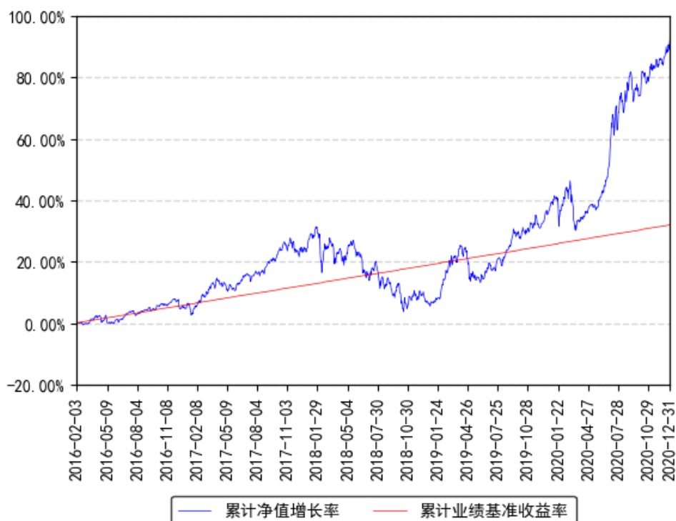
南方君选灵活配置混合累计净值增长率与同期业绩比较基准收益率的历史走势对比图