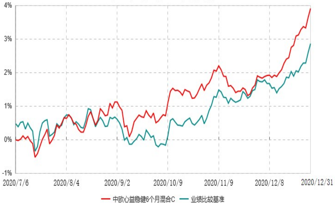
中欧心益稳健6个月混合C累计净值增长率与业绩比较基准收益率历史走势对比图 (2020年07月06日-2020年12月31日)

注：本基金基金合同生效日期为2020年7月6日，自基金合同生效日起到本报告期末不满一年，按基金合同的规定，本基金自基金合同生效起六个月为建仓期，建仓期结束时各项资产配置比例应当符合基金合同约定。