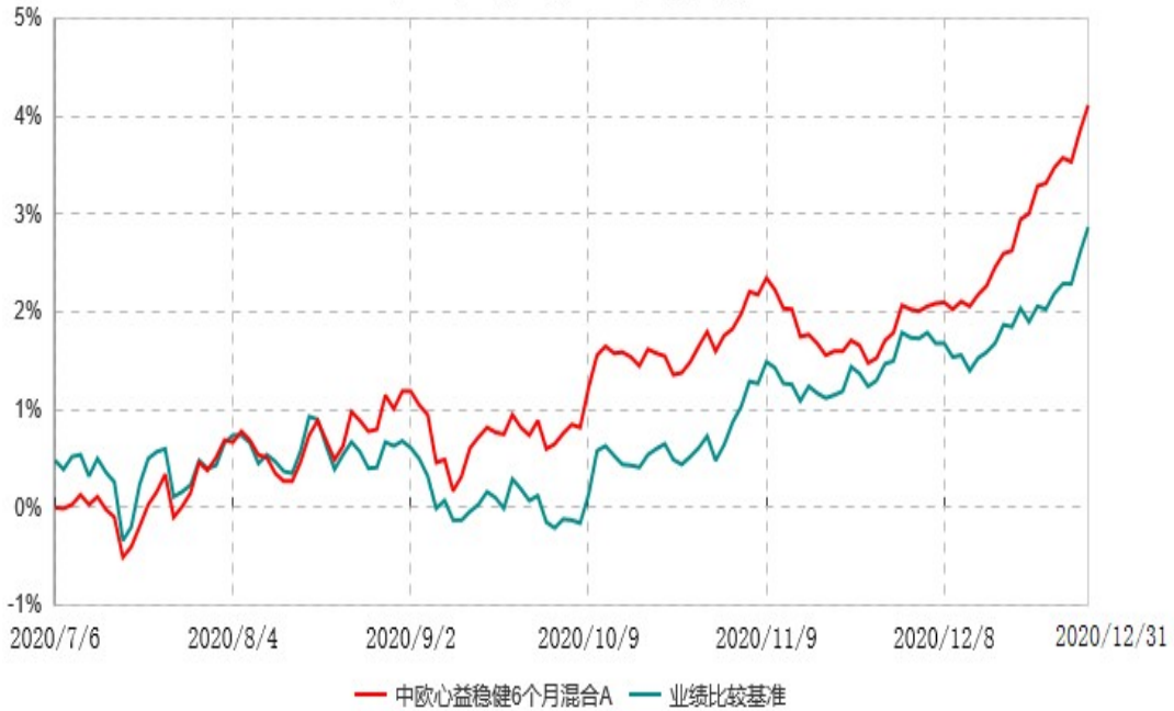
中欧心益稳健6个月混合A累计净值增长率与业绩比较基准收益率历史走势对比图 (2020年07月06日-2020年12月31日)

注：本基金基金合同生效日期为2020年7月6日，自基金合同生效日起到本报告期末不满一年，按基金合同的规定，本基金自基金合同生效起六个月为建仓期，建仓期结束时各项资产配置比例应当符合基金合同约定。