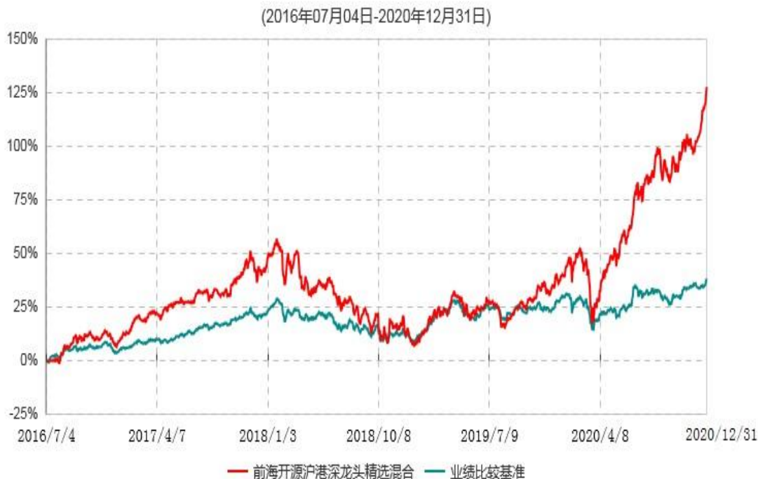
前海开源沪港深龙头精选灵活配置混合型证券投资基金累计净值增长率与业绩比较基准收益率历史走势对比图