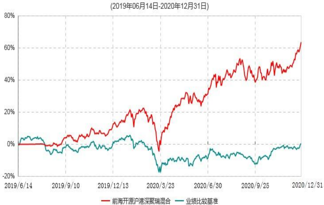
前海开源沪港深聚瑞混合型证券投资基金累计净值增长率与业绩比较基准收益率历史走势对比图