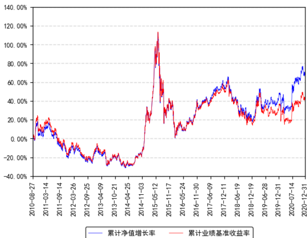
南方小康ETF累计净值增长率与同期业绩比较基准收益率的历史走势对比图