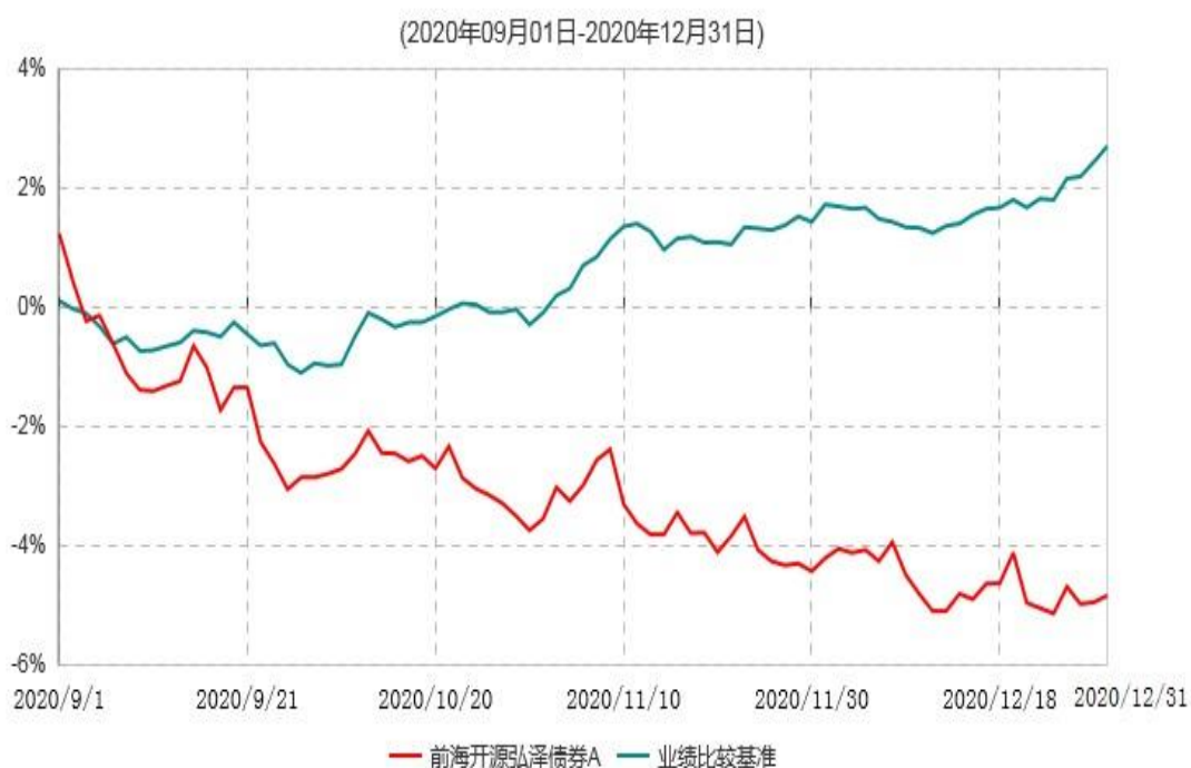
前海开源弘泽债券A累计净值增长率与业绩比较基准收益率历史走势对比图