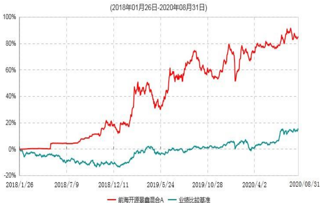
前海开源景鑫混合A累计净值增长率与业绩比较基准收益率历史走势对比图