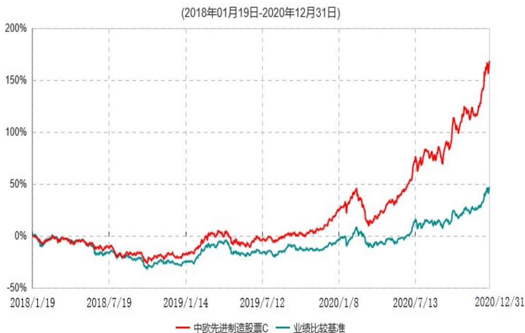
中欧先进制造股票C累计净值增长率与业绩比较基准收益率历史走势对比图

注：自 2020 年 8 月 14 日起，本基金的业绩比较基准由“申银万国制造业指数收益率*75%+恒生指数收益率*10%+中证综合债券指数收益率*15%”修改为“中证新能源指数收益率*60%+中证高端装备制造指数收益率*20%+中证港股通工业综合指数收益率*10%+中证债券指数收益率*10%”。