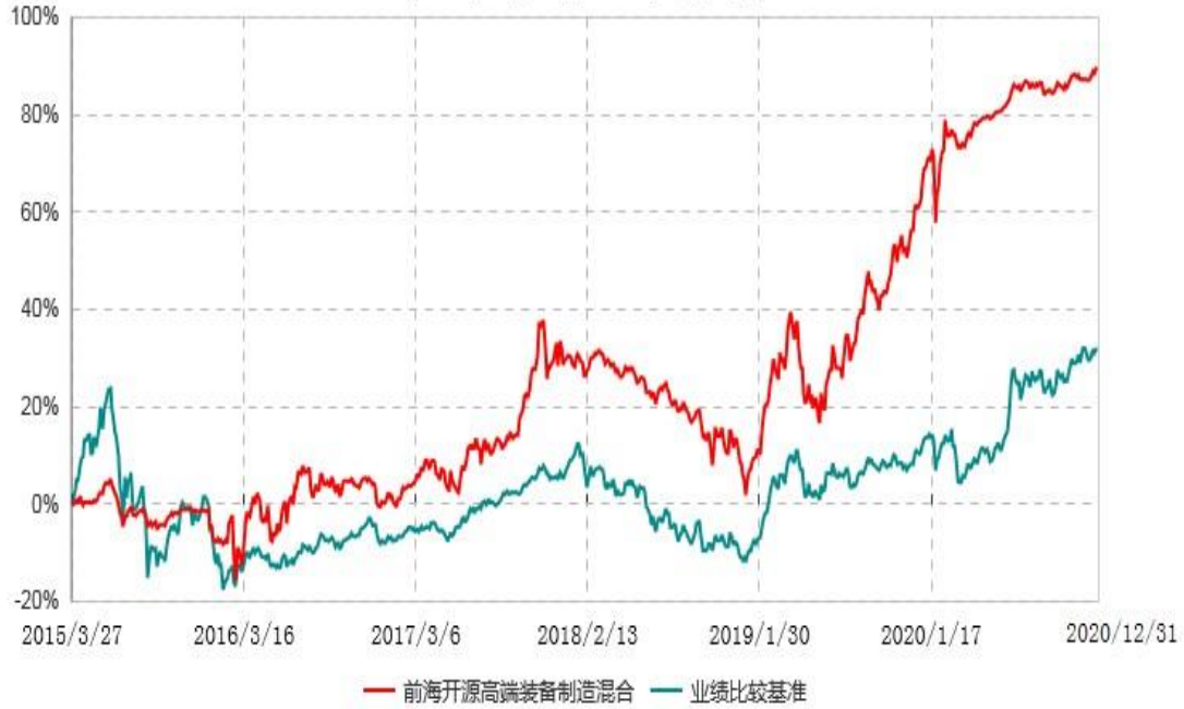
前海开源高端装备制造灵活配置混合型证券投资基金累计净值增长率与业绩比较基准收益率历史走势对比图 (2015年03月27日-2020年12月31日)