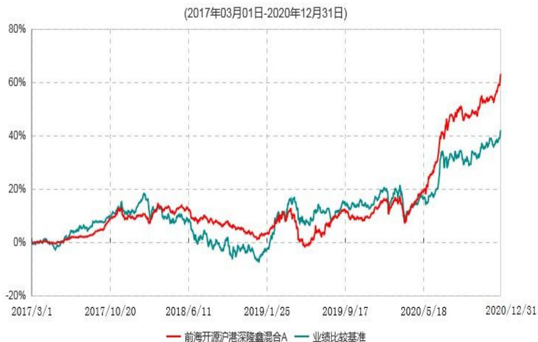
前海开源沪港深隆鑫混合A累计净值增长率与业绩比较基准收益率历史走势对比图