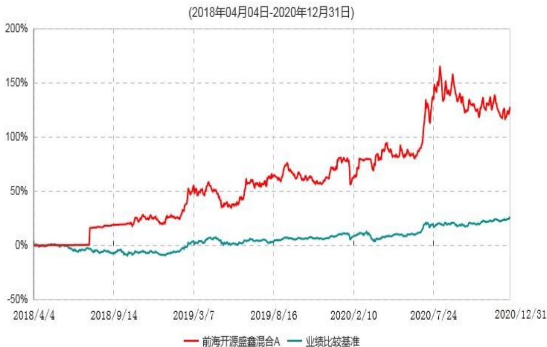
前海开源盛鑫混合A累计净值增长率与业绩比较基准收益率历史走势对比图