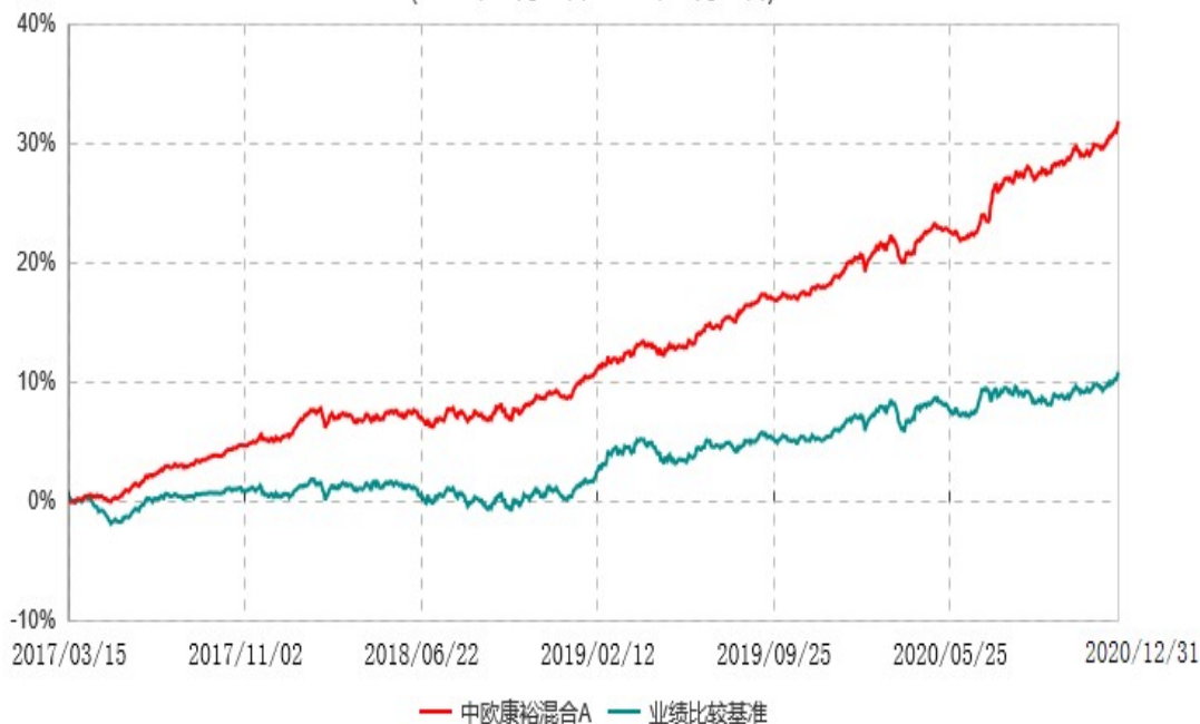
中欧康裕混合C累计净值增长率与业绩比较基准收益率历史走势对比图