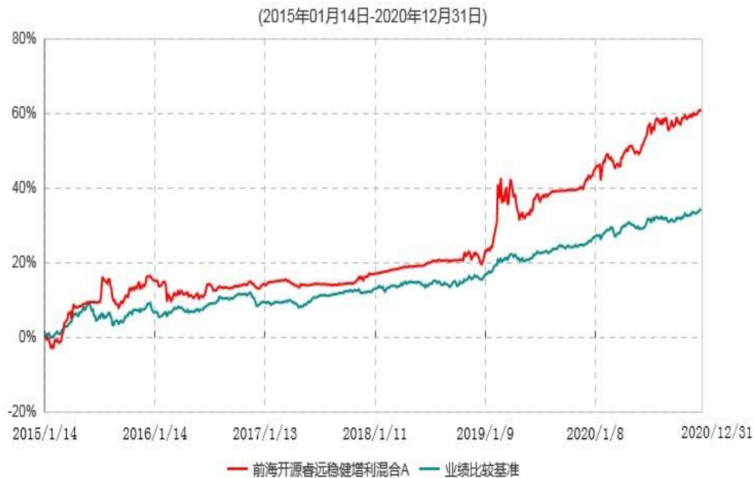
前海开源睿远稳健增利混合A累计净值增长率与业绩比较基准收益率历史走势对比图