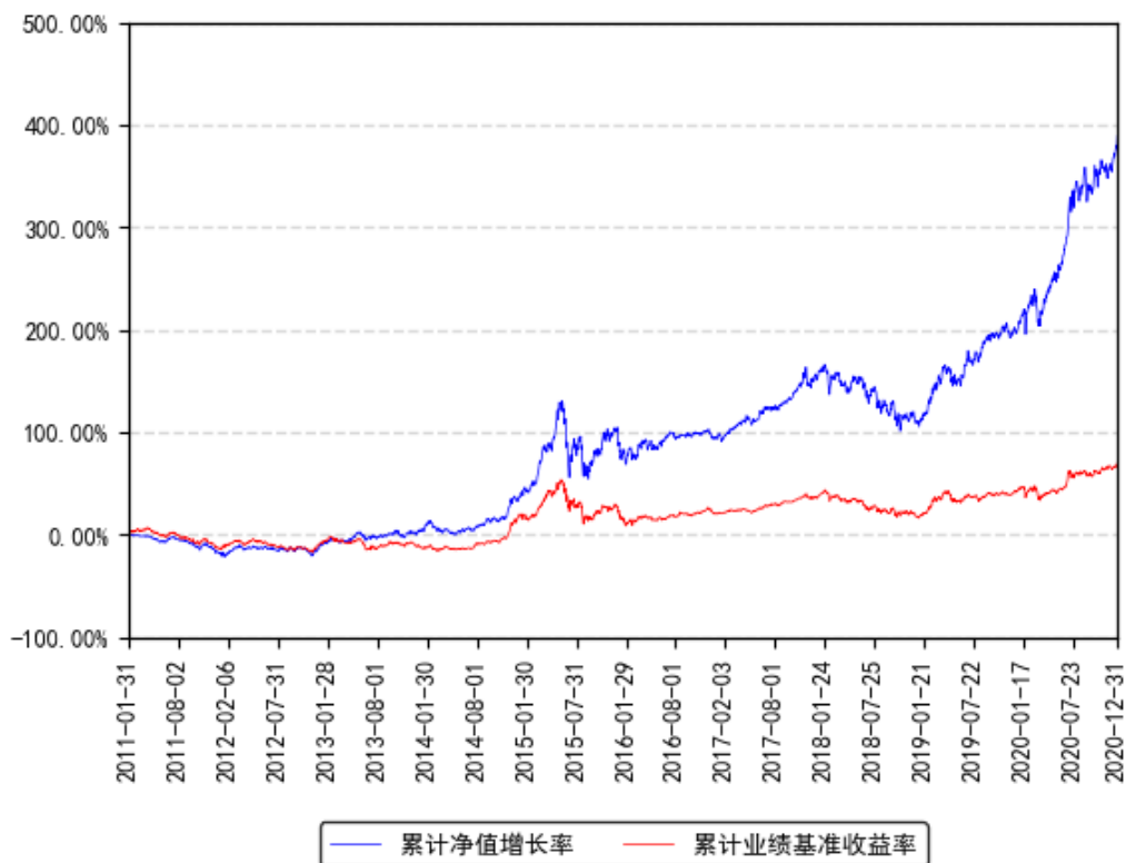
南方优选成长A累计净值增长率与同期业绩比较基准收益率的历史走势对比图