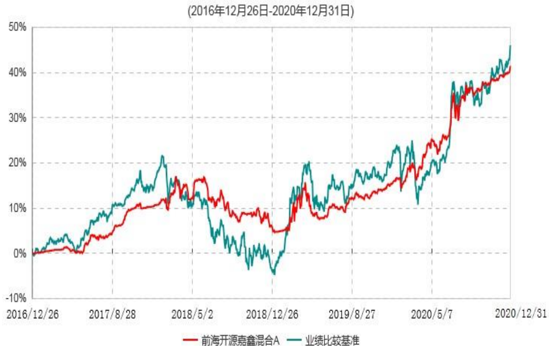
前海开源嘉鑫混合A累计净值增长率与业绩比较基准收益率历史走势对比图