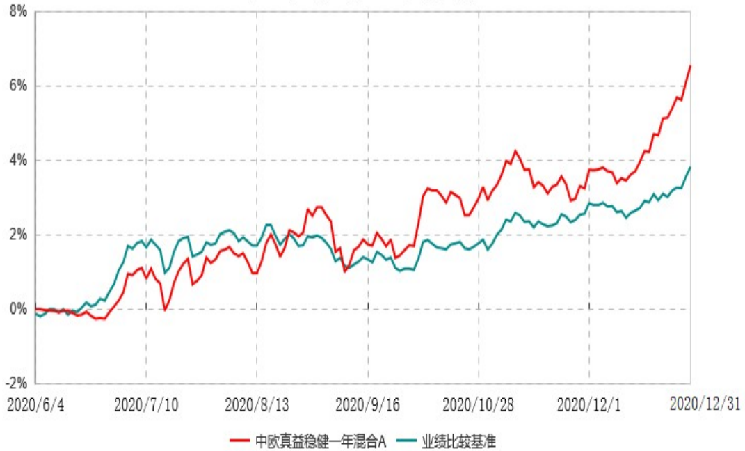
中欧真益稳健一年混合A累计净值增长率与业绩比较基准收益率历史走势对比图 (2020年06月04日-2020年12月31日)

注：本基金基金合同生效日期为2020年6月4日，自基金合同生效日起到本报告期末不满一年，按基金合同的规定，本基金自基金合同生效起六个月为建仓期，建仓期结束时各项资产配置比例已符合基金合同约定。