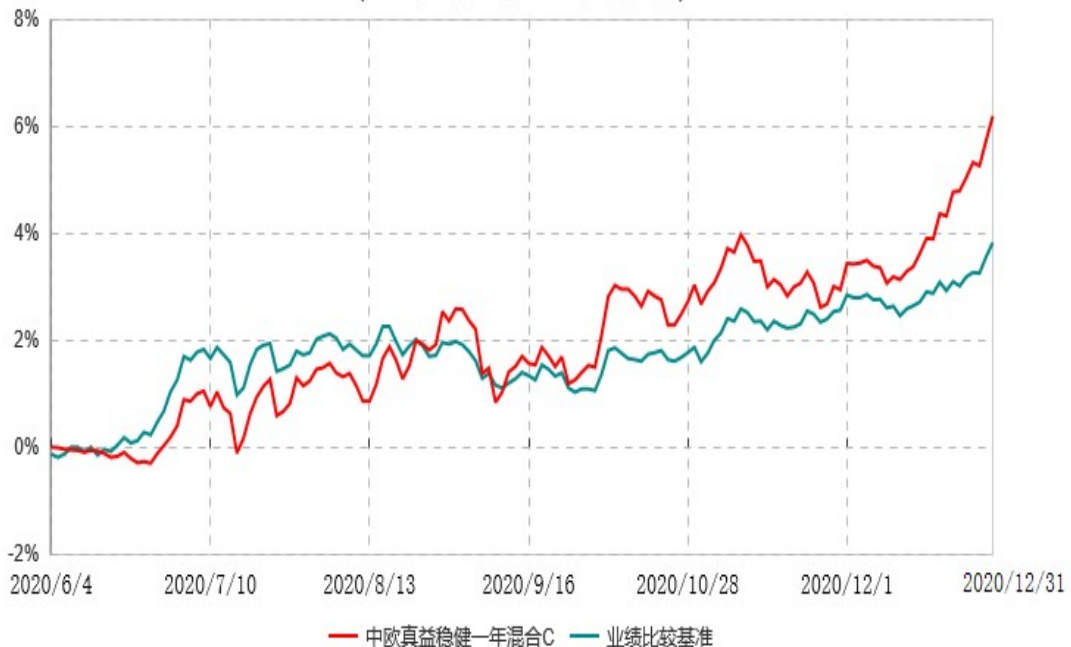
中欧真益稳健一年混合C累计净值增长率与业绩比较基准收益率历史走势对比图 (2020年06月04日-2020年12月31日)

注：本基金基金合同生效日期为2020年6月4日，自基金合同生效日起到本报告期末不满一年，按基金合同的规定，本基金自基金合同生效起六个月为建仓期，建仓期结束时各项资产配置比例已符合基金合同约定。