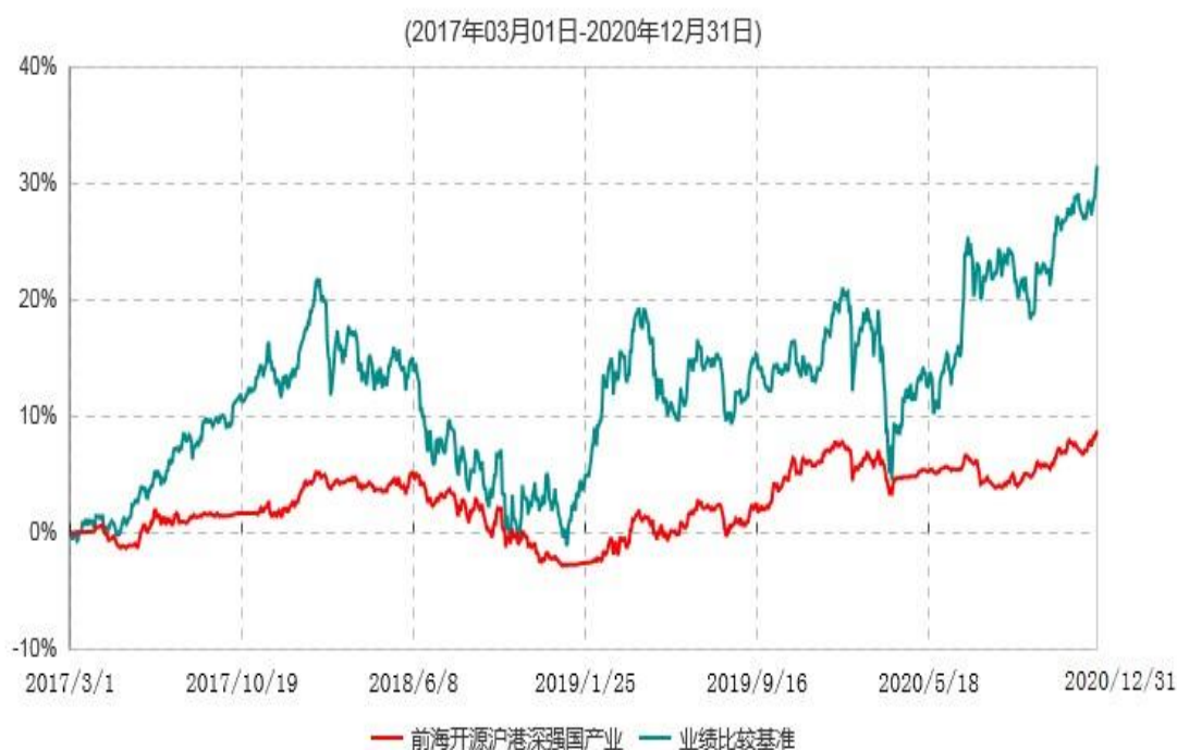
前海开源沪港深强国产业灵活配置混合型证券投资基金累计净值增长率与业绩比较基准收益率历史走势对比图