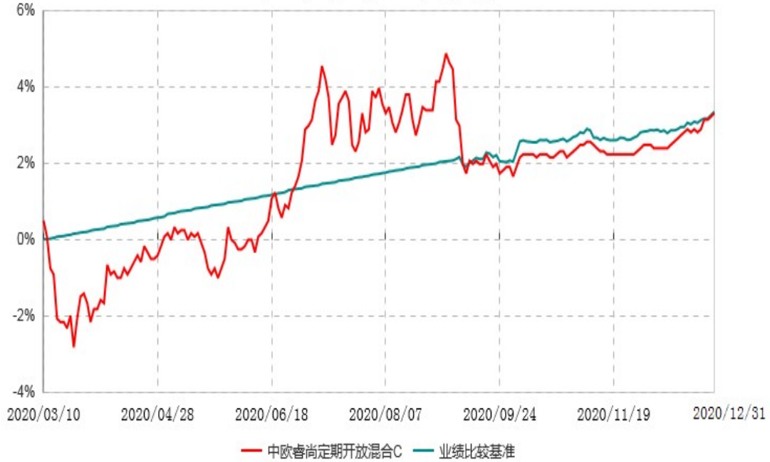
中欧睿尚定期开放混合C累计净值增长率与业绩比较基准收益率历史走势对比图 (2020年03月10日-2020年12月31日)

注：自 2020 年 3 月 9 日起，本基金增加 C 份额。自 2020 年 9 月 8 日起，本基金的业绩基准由“同期中国人民银行公布的三年期银行定期存款税后收益率+1.5%”修改为“中证中信证券量化债股联动稳健策略指数收益率”。图示日期为 2020 年 3 月 10 日至 2020 年 12 月 31 日。